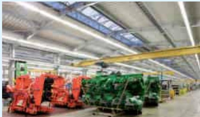
Gesamtansicht der Produktionshalle

Die Geschäftsleitung der Maschinenfabrik Kemper, Stadtlohn, und die beauftragten Architekten und Planer trugen von Anfang an das Konzept mit und entschieden sich für den Einsatz von handelsüblichen gelochten Trapezblechen, die mit Akustikmineralwolle als Sickenfüller hinterlegt wurden.