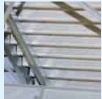
Verwendet wurden handelsübliche gelochte Trapezbleche