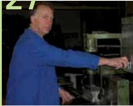
Gegen alle Widerstände: Metall-BG bringt 58-Jährigen zurück in Lohn und Brot