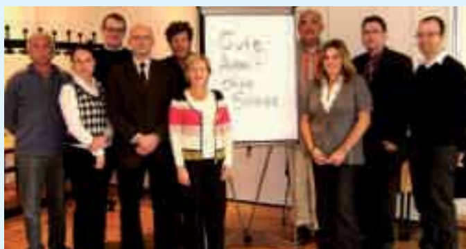
Vertreter verschiedener Institutionen machen gemeinsame Sache gegen den Stress am Arbeitsplatz

Regionalteil VMBG-Mitteilungen der Hütten- und Walzwerks-Berufsgenossenschaft und der Maschinenbau- und Metall-Berufsgenossenschaft, Postfach 101015, 40001 Düsseldorf, Telefon (02 11) 82 24 - 626, Telefax (02 11) 82 24 - 205, Internet: www.mmbg.de, E-mail: pressestelle@mmbg.de. Verantwortlich: Georg Kunze, Hauptgeschäftsführer der Berufsgenossenschaften. Redaktion: Heinz-Rudolf Neumann (verantwortlich), Dipl.-Ing. Annette Schubert (Technik), Nachdruck mit Quellenangabe und nach vorheriger Vereinbarung mit der Redaktion gestattet.