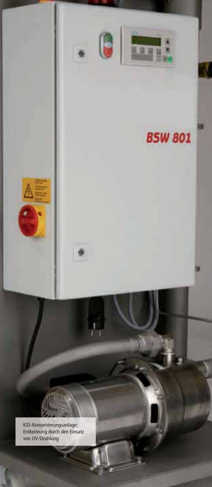
KSS-Konservierungsanlage: Entkeimung durch den Einsatz von UV-Strahlung