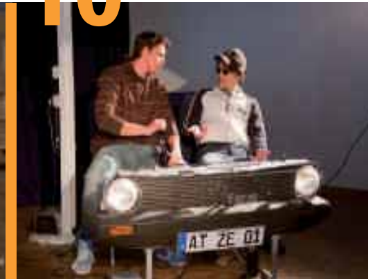
Arbeitssicherheit für Auszubildende: Eine Werft geht neue Wege