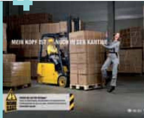
RISIKO RAUS: Mit dem neuen Jahr beginnt auch eine neue Kampagne der BGen