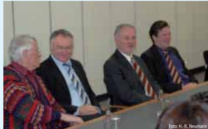
Unter den Gästen bei der Vertreterversammlung der MMBG waren auch Mitglieder der Selbstverwaltung und der Hauptgeschäftsführung der Holz-BG

3. Grundsätzlich befürwortet die Vertreterversammlung der MMBG die Fortführung der Gespräche über eine Fusion auch mit der BGM Nord Süd durch die Verhandlungskommissionen der HWBG, der MMBG, der BGM Nord Süd und der HBG. Ziel dieser Gespräche muss es sein, vor einer Fusion übereinstimmende Eckpunkte und einen gemeinsamen Fusionsvertrag zu vereinbaren. Außerdem müssen die fehlenden Voraussetzungen für eine Fusion gemäß § 118 Abs. 1 SGB VII vereinbart werden.“