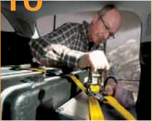
Sicher transportieren und fahren – das Schwerpunktthema im Februar 2010